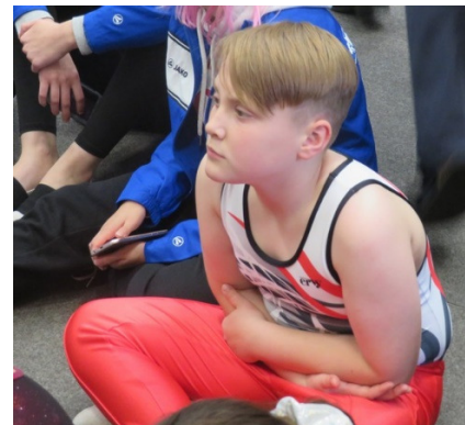
noch ist Vico skeptisch