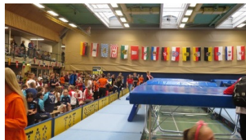
Blick in die Halle