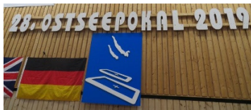
Willkommen in Sörup