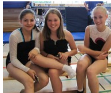
neue Freundin gefunden