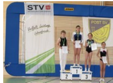
Lavinja (1. Platz)