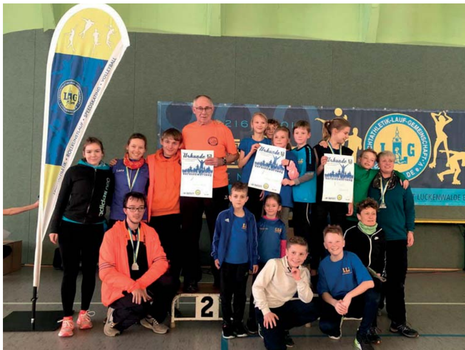
In der Vereinsgesamtwertung kommen die LG Südler Aif Platz 2

überholte uns der Veranstalter LLG Luckenwalde und drängte uns auf Platz 2 mit folgendem Ergebnis ab: 7 x Platz 1, 9 x Platz 2 und 4 x Platz 3