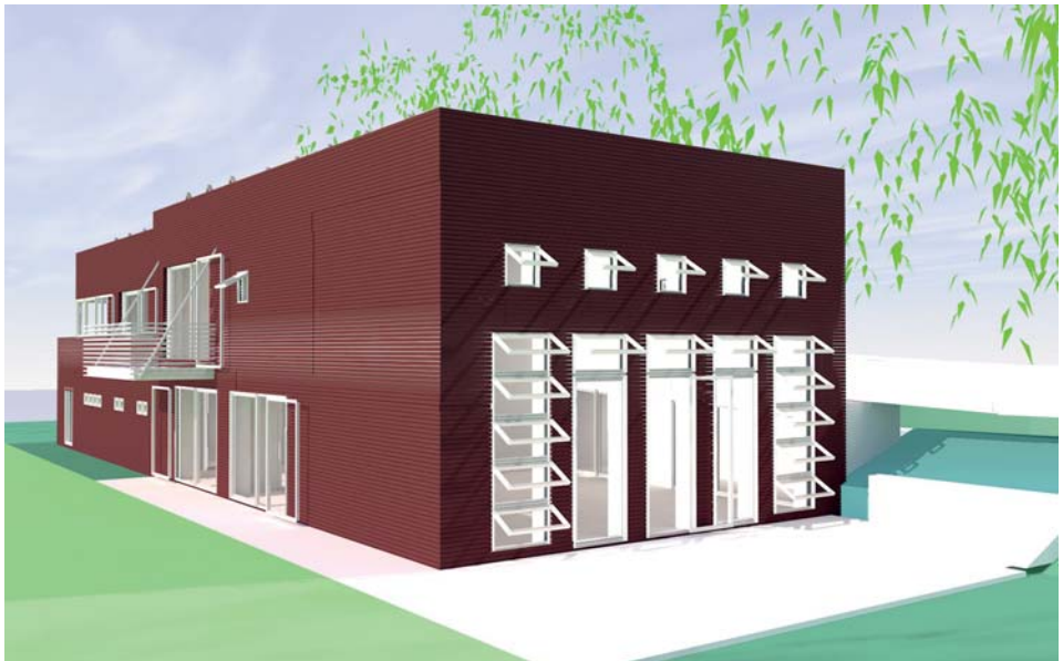
TuSLi-NTH1: Entwurf Architekt Volkmann

Eine ganz andere Herausforderung wird das Sammeln von Spendengeldern sein. Wir haben in den letzten Wochen bewusst auf solche Schreiben und Bitten verzichtet.