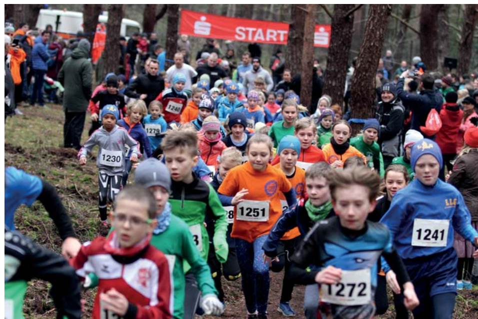
Start der Altersklasse U12-U10 zum letzten Lauf 2020